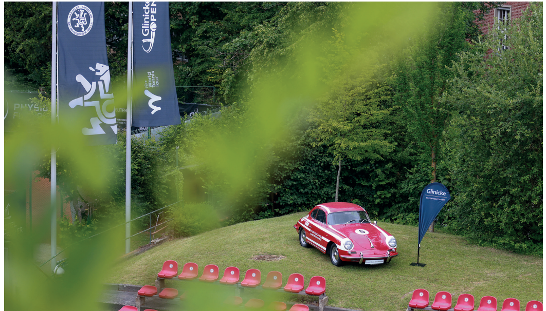
Ein Oldtimer als Hingucker: der Porsche 356 BT 5 Coupé aus dem Porsche Classic Zentrum ist schon zum Wahrzeichen der Glinicke Open geworden.