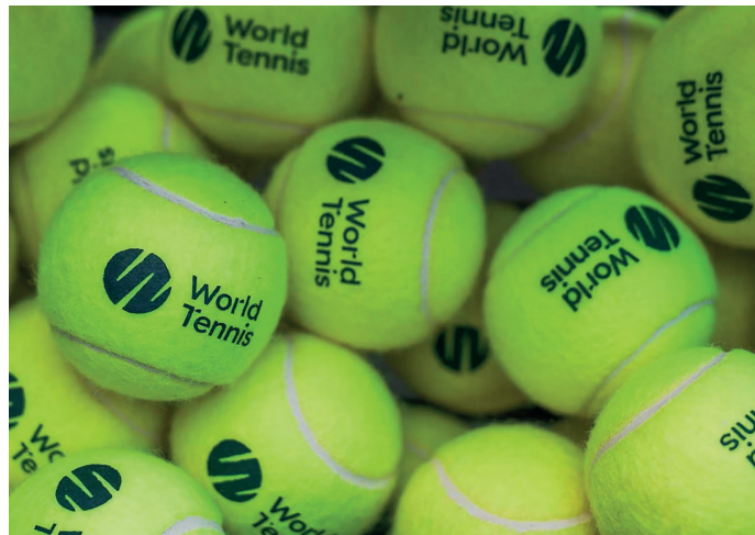
Auch hier alles neu: Seit kurzem heißt die ITF „World Tennis“.