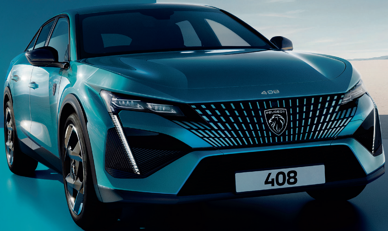
Abb. zeigt nicht angebotenes Beispielfahrzeug.