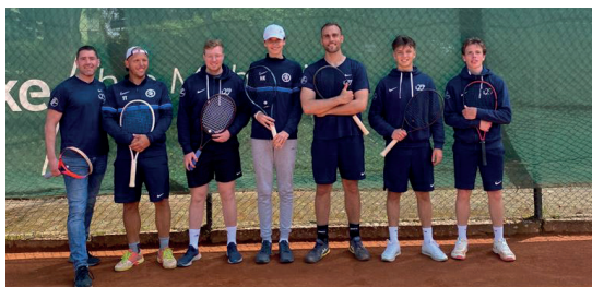
Aufgestiegen: Herren II.

Nicht die einzige freudige Botschaft an diesem brütend heißen Tag. Denn auch die 2. Herren schafften nach dem 8:1 gegen Oldeshausen den Sprung in die Gruppenliga. Mit dem Aufstieg der Herren 40 in die Bezirksoberliga wurde die bishe-