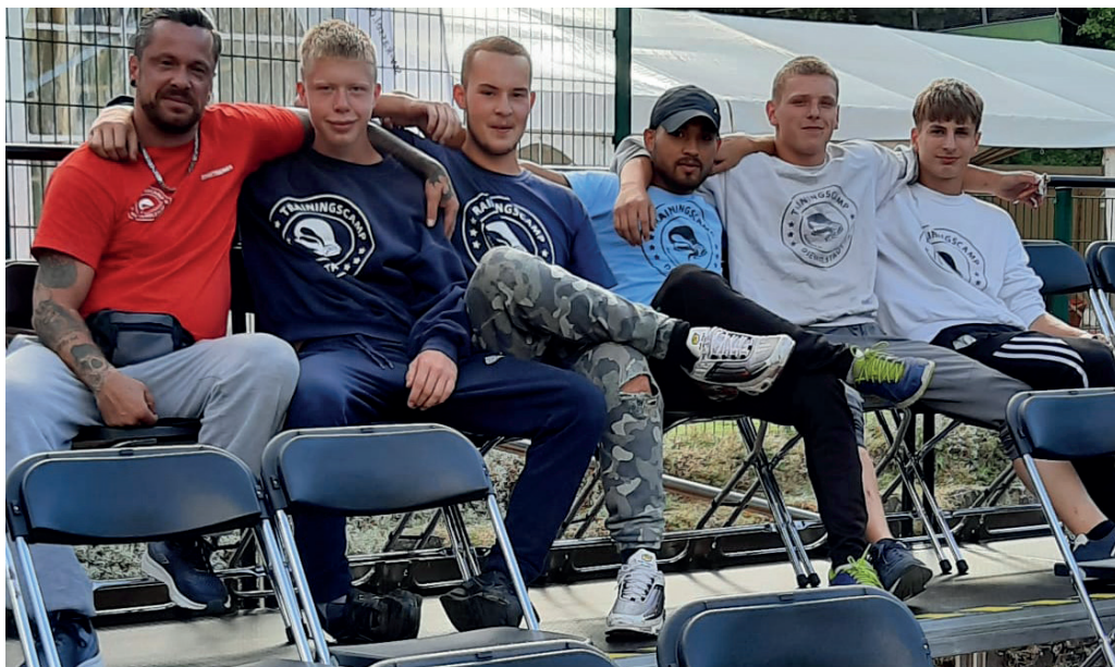
Die Jungs vom Trainingscamp Diemelstadt waren beim Tribünaufbau eine große Hilfe.